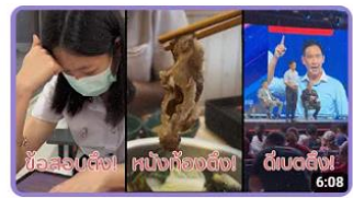
ข้อสอบตั้ง หนังสือตั้ง ดีเบตตั้ง...ในวันสอบวันสุดท้าย 45 views · 5 months ago