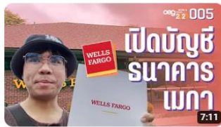
เด็ก Work & Travel เปิดธนาคารเองที่อเมริกาขำกั๊ว | work and travel: MEGA 005 94 views · 1 month ago