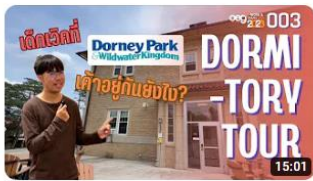
เดินทางสู่ที่พัก เด็ก Dorney Park เค้าอยู่กันอย่างไรจ้ะ!!! | work and travel: MEGA 003 110 views · 3 months ago