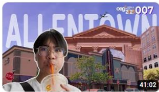
40+ minutes with Allentown (PA, USA) | work and travel: MEGA S1E7 95 views · 11 days ago