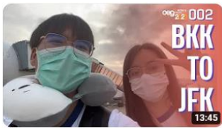
คนไม่เคยนั่งเครื่องบิน แต่ต้องไปบินไปฝั่งอเมริกา | work and travel: MEGA 002 509 views · 4 months ago