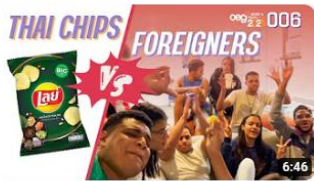
I shared Thai-only Lays' flavour with foreigners. Their reaction is so incredible!!! ... 119 views · 1 month ago