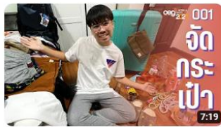
จัดกระเป๋าเตรียมไป work & travel USA กัน! | work and travel: MEGA 001 208 views · 5 months ago