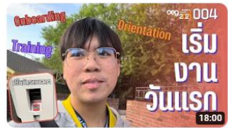
ทำอะไรบ้างในวัน Start Date (Onboarding / Training/ Orientation) | work and travel: ... 123 views · 2 months ago